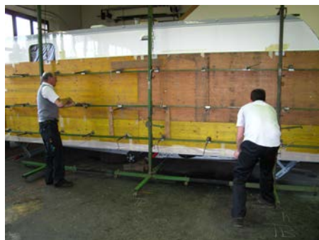
12. Anbringen der Anpressvorrichtung...