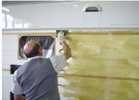
10.1 ...und anschließend ...