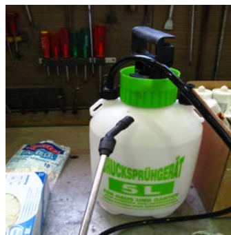
7.2 ...dabei hilft das Wassersprüngerät.