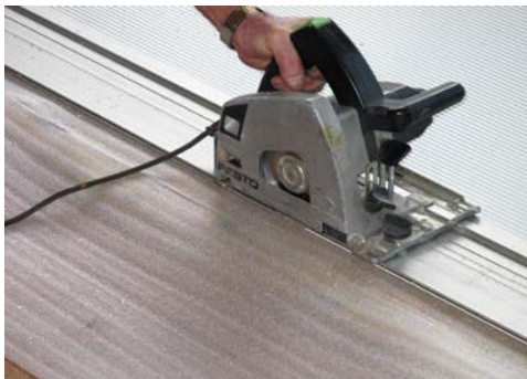
5. Blech wird zugeschnitten