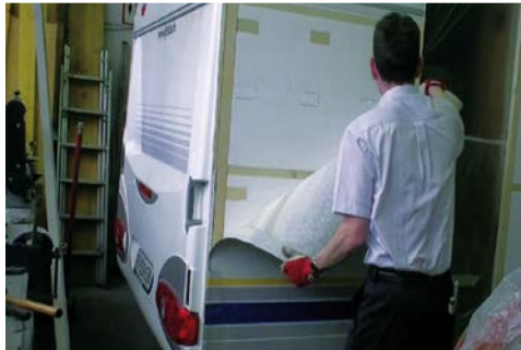
2. Abschälen des beschädigten Alublechs