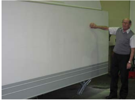
13. Anpressvorrichtung entfernen