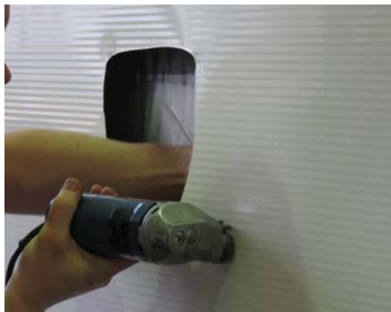
14. Nun können Fenster, Türen und Luken ausgeschnitten werden...